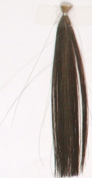
オレンジ：インディゴ 1：1.5