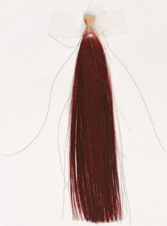
モカ：ラズベリー：クリア 1：2：2