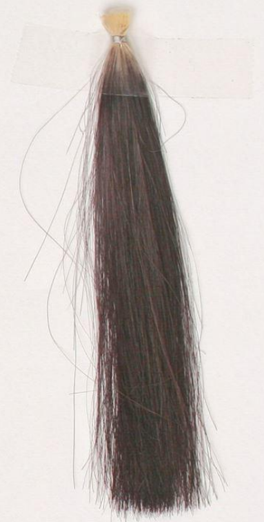
(グアイネスト：インディゴ：A-7B)：クリア 3：1：4 1：2