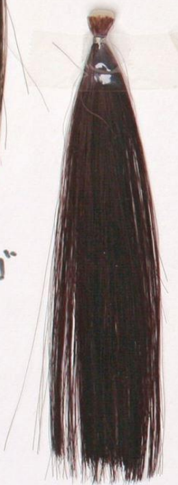
A-77ラウニ：ラズベリー 1：1