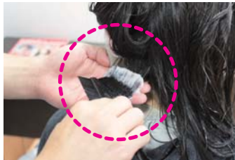
髪の根本への1剤塗布

今回のモデルさんは、3ヶ月前に縮毛矯正をかけた履歴があり、根本に3~4cmの新しいクセができています。カラーはしていません。 特に顔周りが軟毛でクセが強い、伸びやすく傷みやすい難しい髪質です。